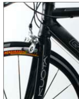
Geliehen: Die Karbon-Gabel kommt von Kuota