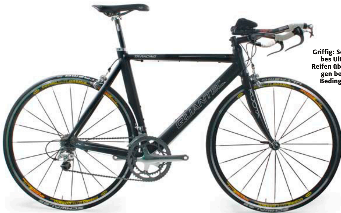
Griffig: Schwalbes Ultrero-Reifen überzeugen bei allen Bedingungen